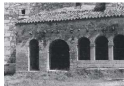
Atrio de la Iglesia de Tamajón con ménsulas románicas. La construcción de aquel templo primitivo se vincula a la presencia del Arzobispo en Tamajón.

moribundo redactar un documento con la fundación de una memoria por su alma en la Catedral de Toledo, memoria que dejó dotada con las rentas de dos villas arzobispaes. Fue enterrado en la capilla de la Trinidad de la Catedral de Toledo.