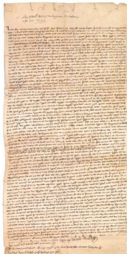
Testamento del Arzobispo de Toledo, D. Juan de Medina Pomar, dado en Tamajón 20/07/1248. Archivo Capitular de la Catedral de Toledo. "Actum est hoc apud Tamaionem, XIII kal. augusti. Anno Dni. MCCXLVIIIº. Era MCCLXXXVLª".